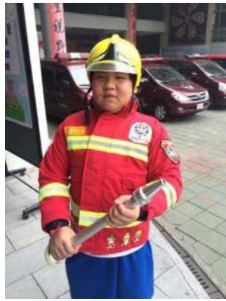
學生著裝完畢，蓄勢待發體驗消防工作