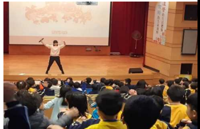
全校宣導流感防疫大作戰