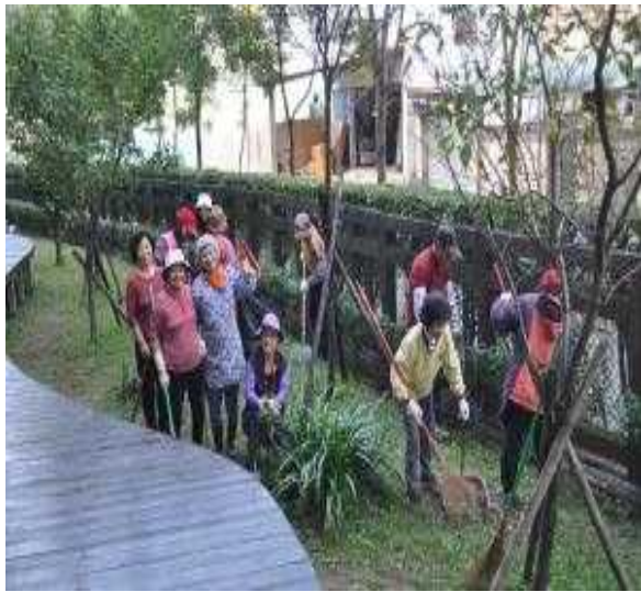
園藝志工維護校園植栽