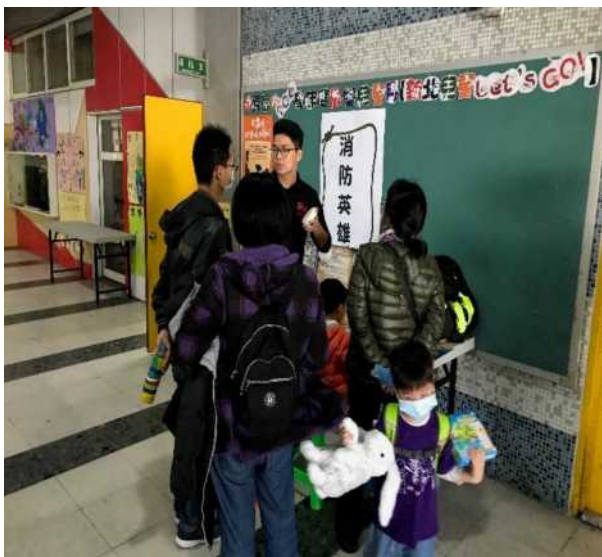
校慶時邀請消防員到校宣導環境居家安全