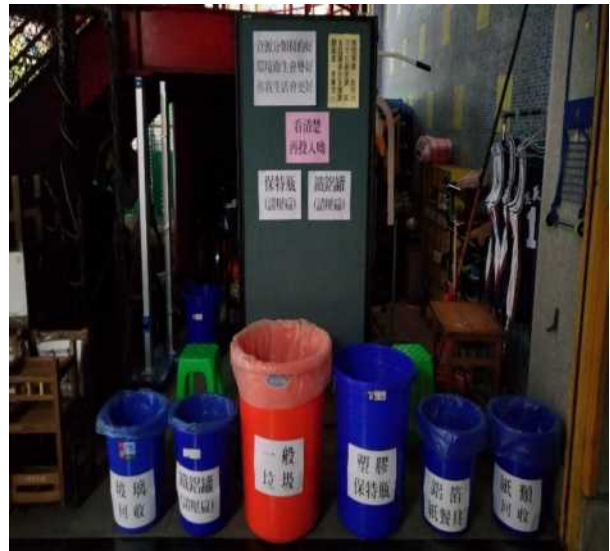
校慶時環保志工協助資源回收