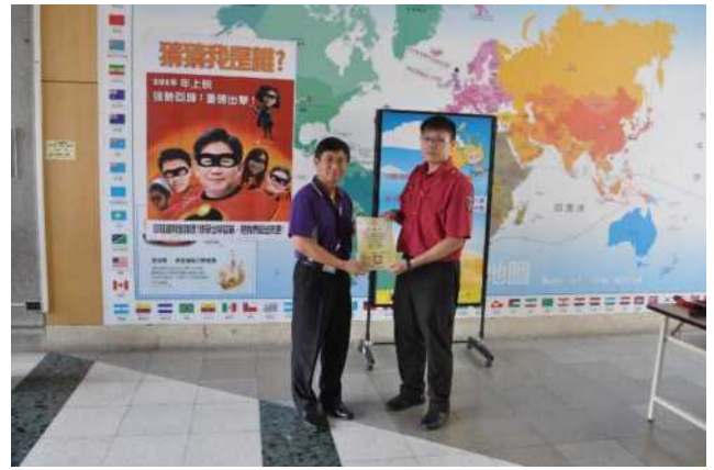
校長頒發感謝狀給鷺江消防隊