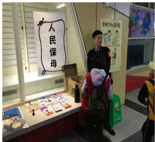
校慶時邀請警察到校宣導環境居家安全