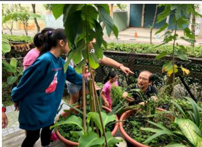
認識校園常見植物