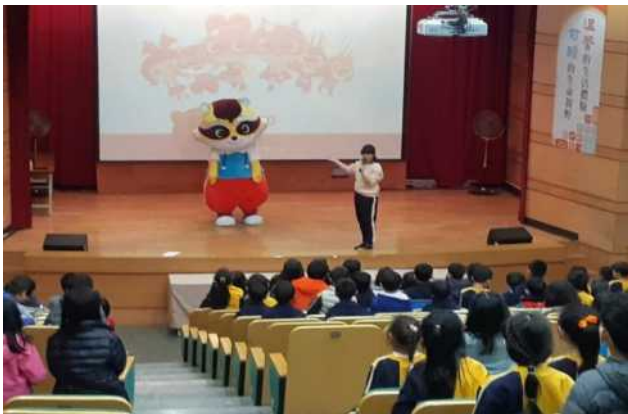
勤洗手，生病在家自主隔離