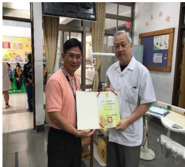
校慶時邀請社區牙醫到校進行潔牙教學 宣導