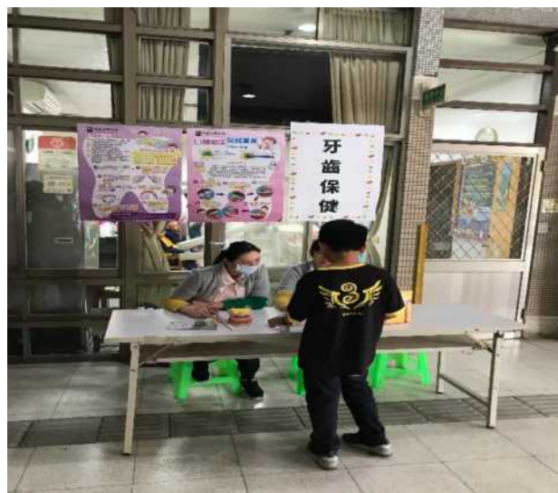
校慶時邀請社區牙醫診所到校進行潔牙 教學宣導