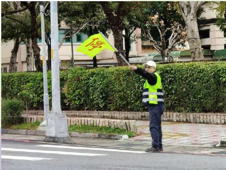
(圖1)以手勢讓車輛停止