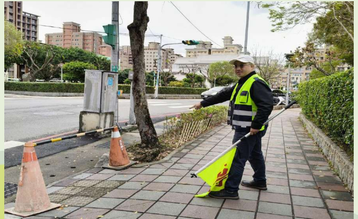
放學時段管制地點