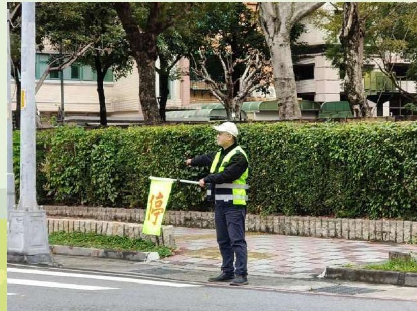
柳堤公園崗(上學/放學時段)