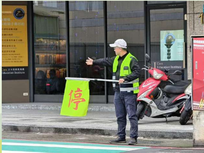
艾卡兒崗(上學時段)